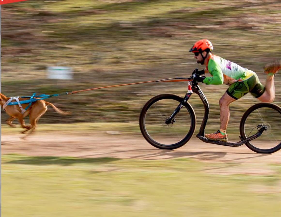
Fotografía: Congela el viento - de Juan Pablo Pascual Santos (ganadora Concurso de Fotografía Mushing Tierra de Dinosaurios 2024)

8-9 DE MARZO DE 2025 · SALAS DE LOS INFANTES · BURGOS