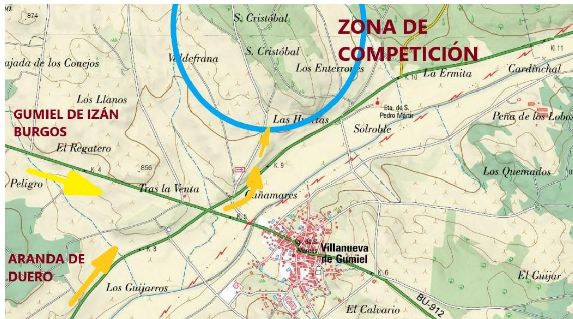
Croquis de acceso

La competición se realizará en el Monte de La Regalada. Se accede desde la zona de parking, avanzando por el camino hacia el norte, distando unos 200 metros tanto la zona de salida como la de meta.